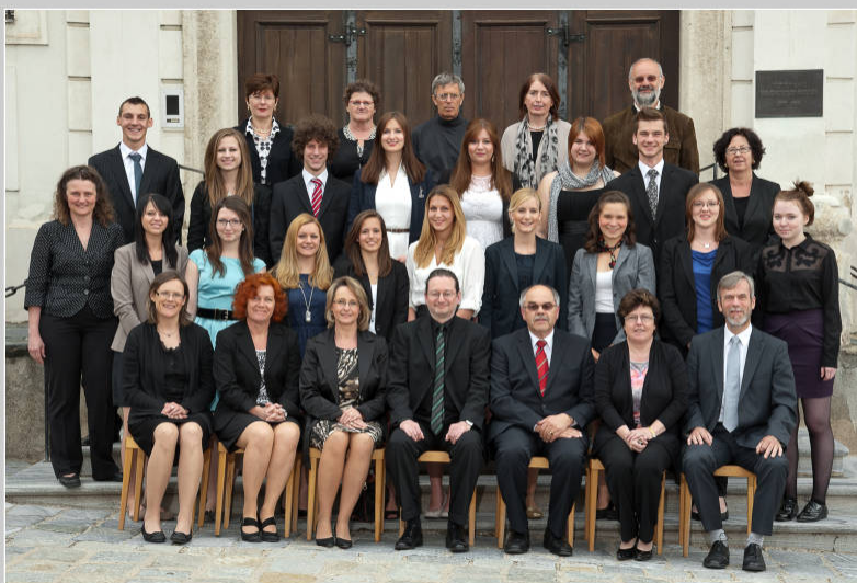
Mary Ward Privat-ORG Matura 2012/13