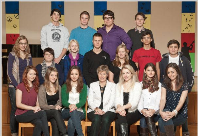
Mary Ward Schulen Privat-ORG Krems Klasse 8B Schuljahr 2012/13