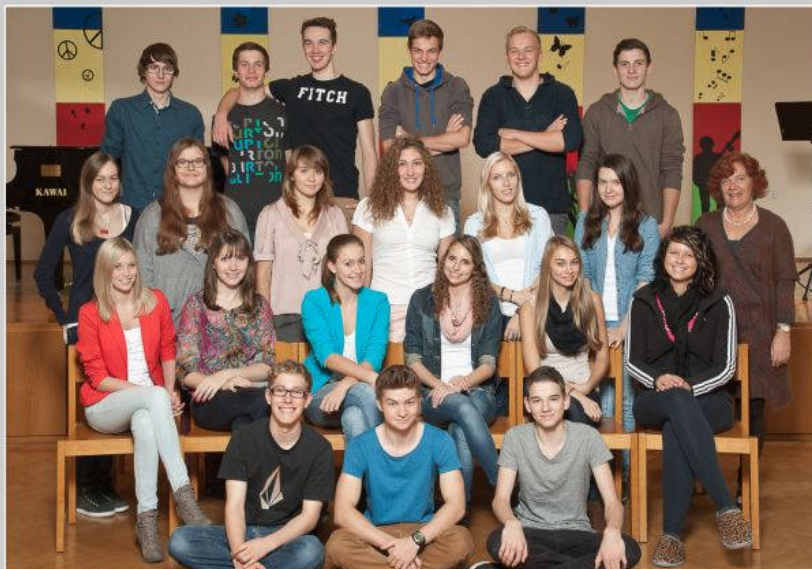
Mary Ward Schulen Privat-ORG Krems Klasse 7A Schuljahr 2012/13