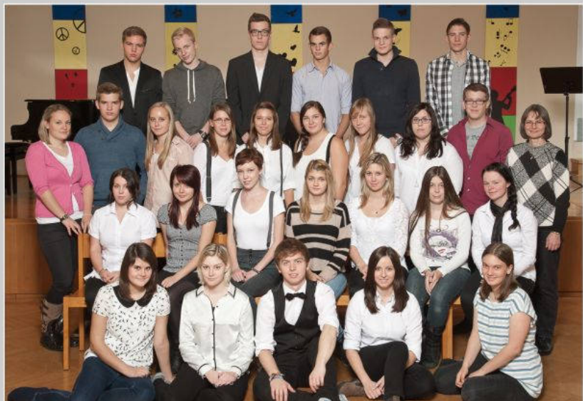
Mary Ward Schulen Privat-ORG Krems Klasse 8C Schuljahr 2012/13