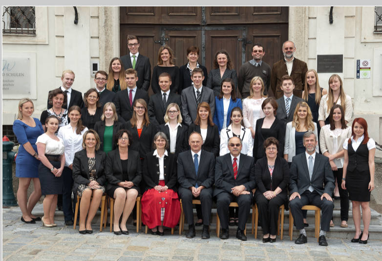
Mary Ward Privat-ORG Matura 2012/13