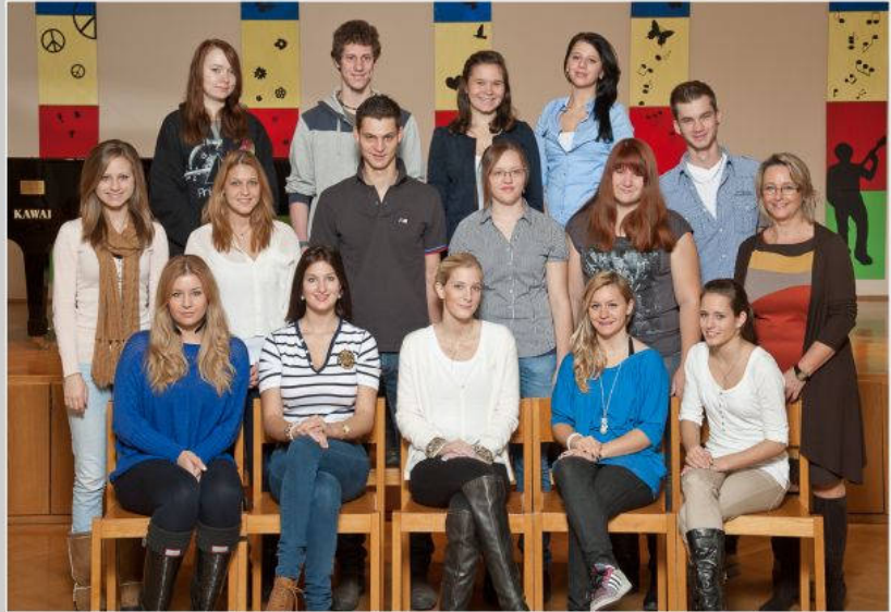
Mary Ward Schulen Privat-ORG Krems Klasse 8A Schuljahr 2012/13