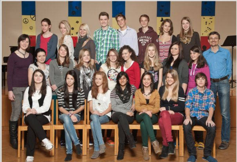
Mary Ward Schulen Privat-ORG Krems Klasse 5B Schuljahr 2012/13