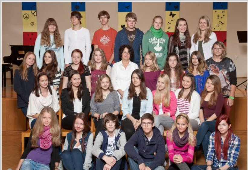
Mary Ward Schulen Privat-ORG Krems Klasse 6A Schuljahr 2012/13