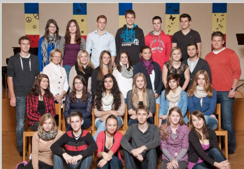
Mary Ward Schulen Privat-ORG Krems Klasse 7B Schuljahr 2012/13