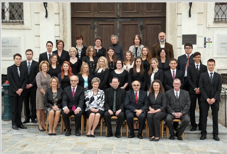
Mary Ward Privat-ORG Matura 2012/13