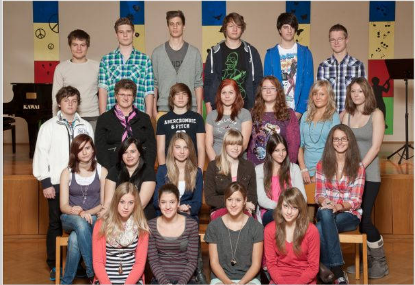
Mary Ward Schulen Privat-ORG Krems Klasse 5A Schuljahr 2012/13