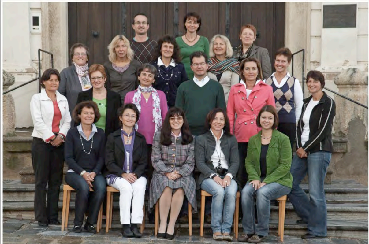
P.HS. Englische Fräulein Krems, Schuljahr 2010/11