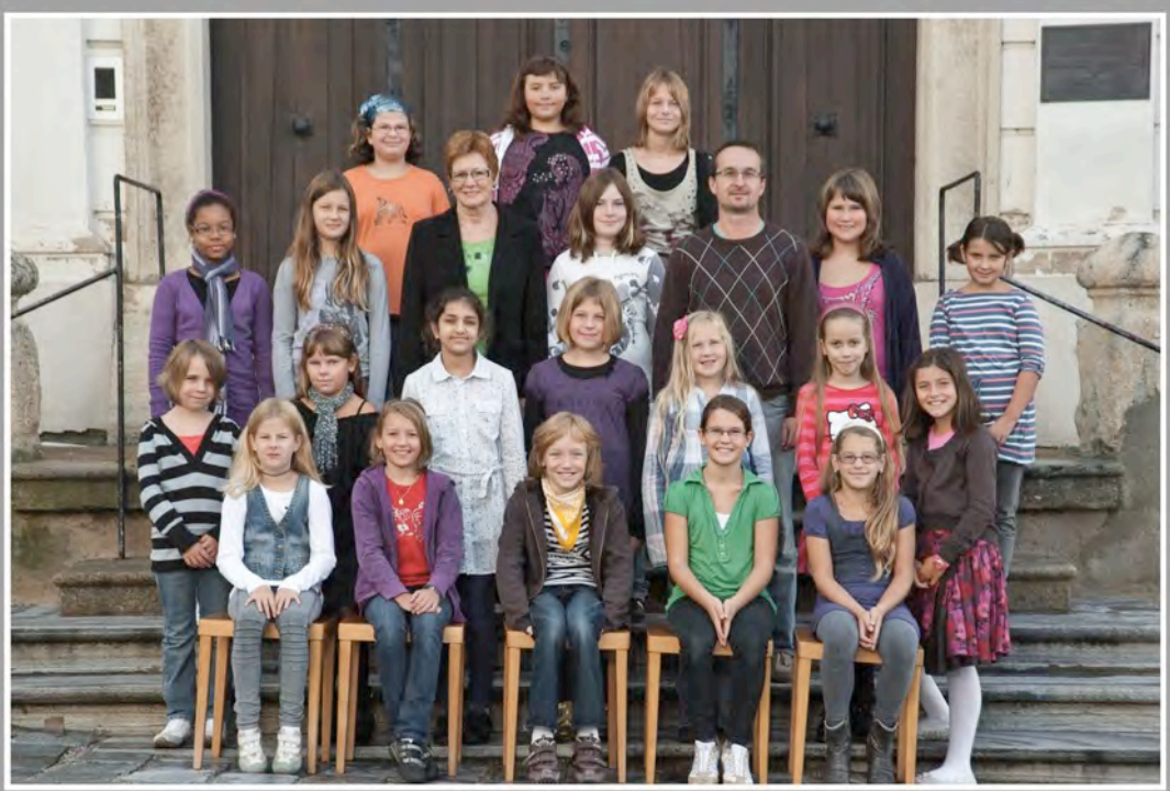
P.HS.Englische Fräulein Krems, Schuljahr 2010/11