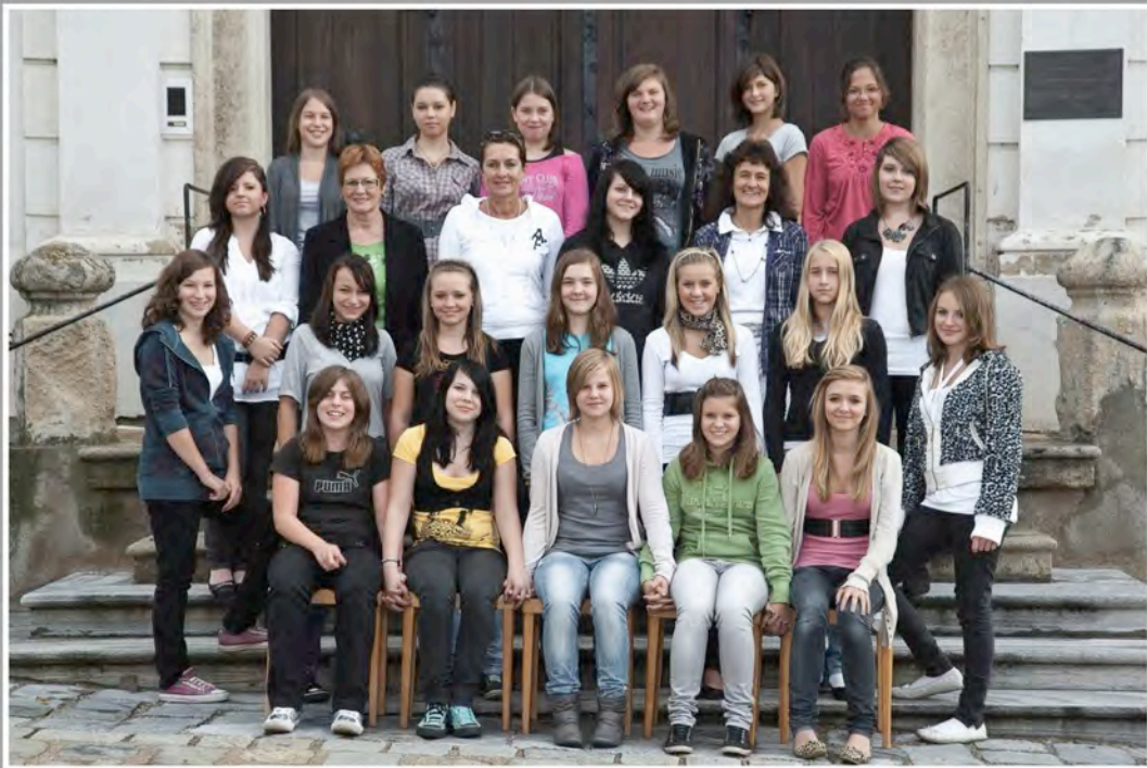
P.HS.Englische Fräulein Krems, Schuljahr 2010/11