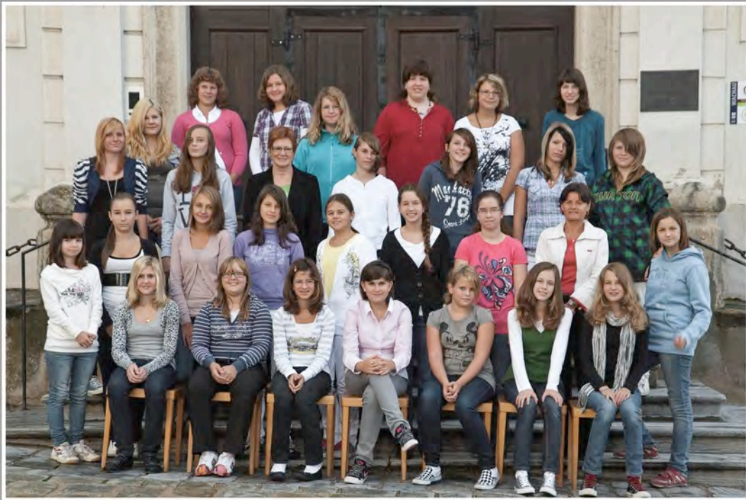
P.HS.Englische Fräulein Krems, Schuljahr 2010/11