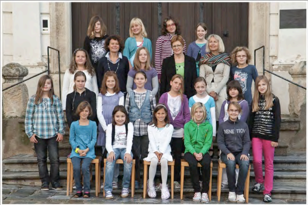
P.HS.Englische Fräulein Krems, Schuljahr 2010/11